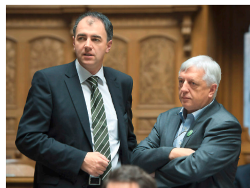
Zusammengespannt: CVP-Präsident Christophe Darbellay und Grüne-Chef Ueli Leuenberger.