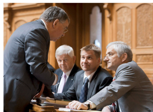
Erfolglos gekämpft: Die SVP-Spitze konnte das Ja zum Ausstieg nicht verhindern.