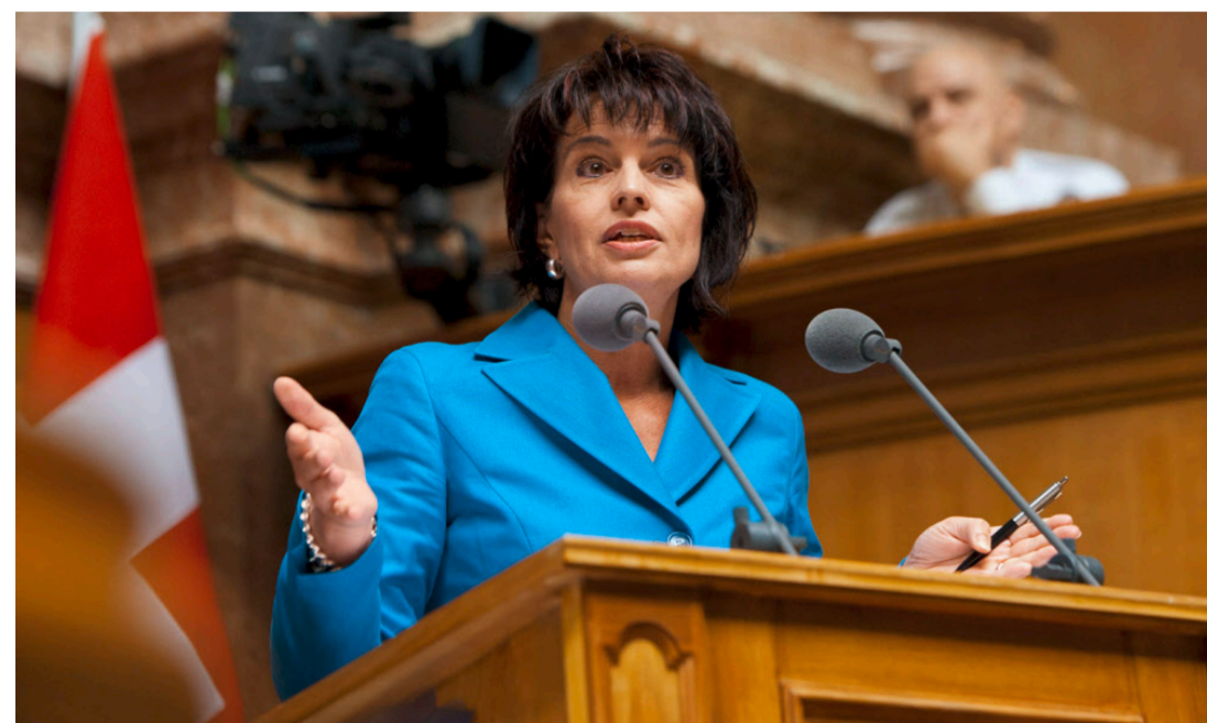
Scharte die Mehrheit des Nationalrats hinter sich: Energieministerin Doris Leuthard.

In vier Vorstössen war die Forderung enthalten, die ältesten Schweizer Reaktoren umgehend abzuschalten. Dazu kamen ähnlich lautende Begehren, welche das nahe der Schweizer Grenze liegende französische AKW Fessenheim betreffen. Der alternde Reaktor löst in der Region Basel in der Bevölkerung Ängste aus. Dennoch lehnte der Nationalrat sämtliche Vorstösse, die in diese Richtung zielten, ab. phm