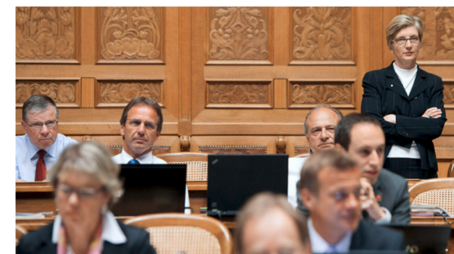
Für ihre Unentschlossenheit kritisiert: Die FDP-Fraktion enthielt sich geschlossen der Stimme.